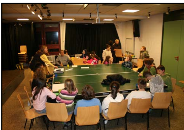
Sitzung der Kinderjury in der Stadtvilla Global

Die Nachbereitungsphase ist die entscheidende Phase der Kinderkonferenz: Die Kinder legten nun selber fest, wie sie zukünftig weiterarbeiten wollten. So vereinbarten sie zum Beispiel regelmäßige Treffen, um die Umsetzung der erarbeiteten Projektvorschläge zu besprechen und zu überwachen. In dem ersten Folgetreffen der Kinderkonferenz in der Stadtvilla Global im Juni 2007 wurde gemeinsam von den teilnehmenden Kindern eine Kinderjury aufgestellt und gewählt. Diese Jury sollte so ähnlich wie ein Kinderparlament funktionieren, allerdings nur bezogen auf die Projektgruppen und -dauer. Es wurden