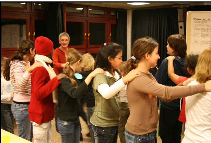
Gruppenspiele zur Auflockerung am Tag der Entscheidung