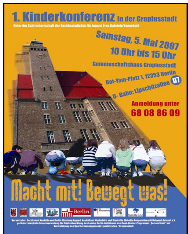
Werbeplakat für die Kinderkonferenz

Ein Telefoninterview der Presse mit dem Kinderbüro im Vorfeld der Konferenz führte zu zwei ausführlichen Presseartikeln im Abendblatt und in der Berliner Woche. Die weitere Pressearbeit ergab einen Filmbericht und einen Mitschnitt des auf die Konferenz einstimmenden Theaterstücks der Theatergruppe der Stadtvilla Global.