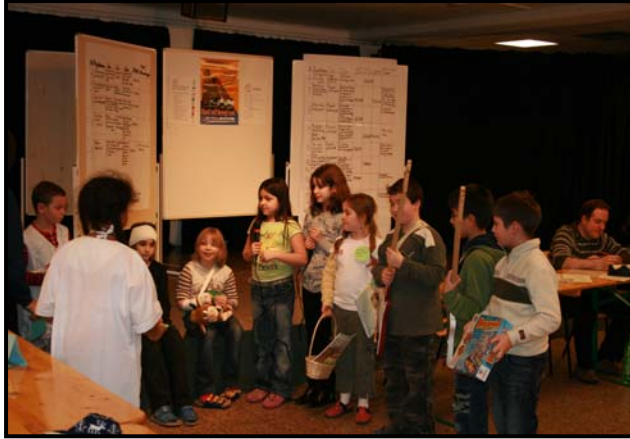
Kinder beim Spielen eines Nachmittags im Krankenhaus

Ein weiteres Projekt, welches im Rahmen der Kinderkonferenz entstand, ist das „KiheKi“- Kinder helfen Kindern/ Projekt von Kindern aus dem Horthaus der Schule am Regenweiher.