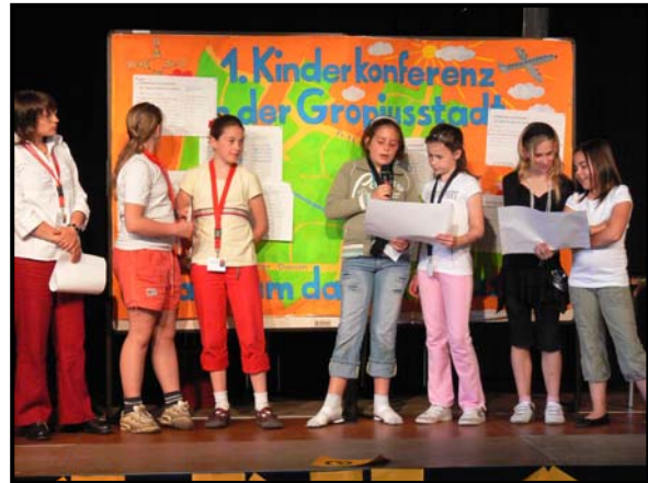
Teilnehmerinnen beim Vortragen ihrer Gruppenergebnisse

Zum Beginn der Kinderkonferenz stellten die Kinder ihre Arbeit aus den Vorbereitungsgruppen vor. Es kristallisierten sich nun fünf Hauptgruppen mit den Themen Freizeit, Schule, Umweltschutz, Tierschutz und Gewalt heraus. In diesen Kleingruppen wurden Planungen und Projektideen erarbeitet und konkretisiert. Besondere Bedeutung wurde hier auf eine umfassende und vielseitige Visualisierung der Ergebnisse gelegt. Es kamen viele Bilder, Plakate, Transparente, Modelle, Sketche, Tanzeinlagen, Ortsteilraps und ein Theaterstück zum Einsatz, die dann für die Übergabe und Präsentation an die Verantwortlichen aus Politik und Verwaltung vorbereitet wurden. Zwischendurch fanden Gruppen- und Kennlernspiele statt und am Ende gab es eine große Kinderdisco zum Ausklang des Tages.