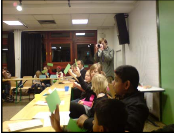
Die Kinder reißen sich um das Abstimmen auf der 6. und entscheidenden Kinderjurysitzung.

Die Abstimmung wurde auf die nächste Jurysitzung am 13. März 2008 vertagt. .Dort standen noch zwei weitere Anträge aus dem Neuköllner Norden vom Kinder- und Jugendzentrum Lessinghöhe und vom Mädchentreff Schilleria an.