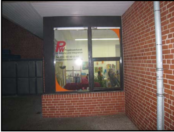
An dieser Stelle wünschten sich die Kinder eine Tür zu dem Platz vor der Projektwerkstatt

Viele Kinder und Eltern trauen sich vielleicht nicht hinein bzw. wissen gar nichts vom Kinderclub. Um in die anderen Gruppenräume bzw. nach draußen zu gelangen, muss man jedes Mal über eine Art „Burghof“. Da dieser Weg den Kindern oft zu weit und umständlich ist, klettern sie oft durch das Fenster nach draußen, was sehr gefährlich sein kann. So haben die Kinder ein Kernproblem am Bau wahrgenommen, dass bisher anscheinend noch von niemanden bemängelt wurde. Ein weiterer Teil der Planung war es, den Platz vor dem Kinderclub durch eine positive Umgestaltung aufzuwerten.