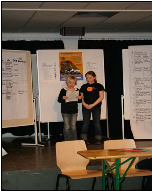
Teilnehmerinnen beim Vorstellen ihres Projekts vor der Kinderjury

Die eingereichten Projektanträge wurden am 24. Januar 2008 auf der 5. Jurysitzung von den Kindern vorgestellt und gesichtet. Kleine Nachkorrekturen wurden empfohlen, Tipps wurden gegeben.